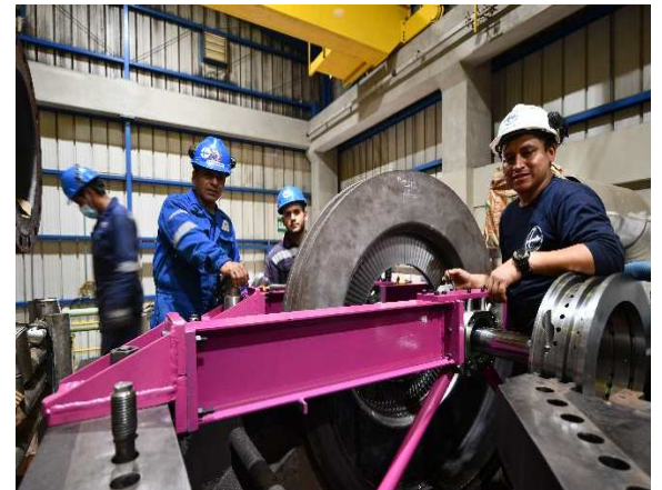
Un trabajo bien hecho ! AAA-7892

Tenemos las herramientas para tubos y bridas: refrentadoras (hasta 199" de diámetro), separadores y alineadores de bridas – además de fresadoras circulares y lineares ... Asimismo, tenemos una amplia selección de herramientas de ajuste de pernos y tuercas: llaves hidráulicas de torque, tensionadores, multiplicadores, equipos para la medición de la elongación de pernos, arandelas antivibraciones, capuchones protectores, etc.