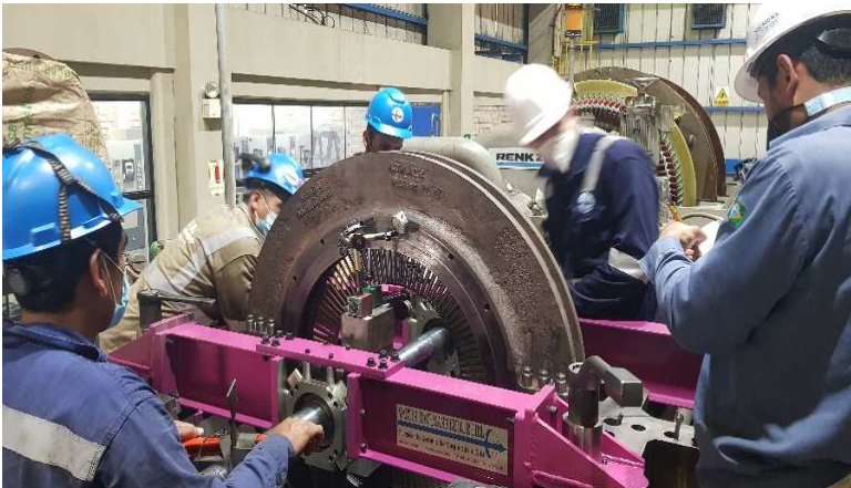
Medicion final y entrega