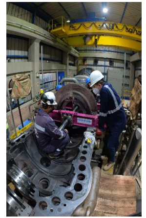
Detalle soporte HP IMG_20220510_155319_00_131