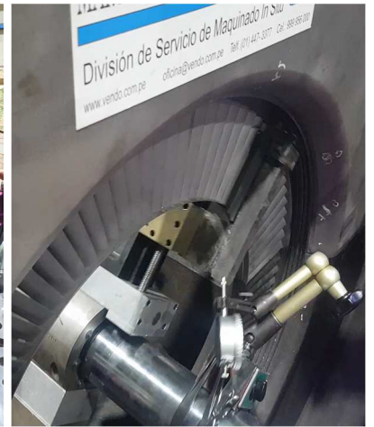
Portacuchilla y maquinado