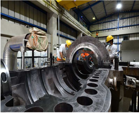
Recepcion del equipo