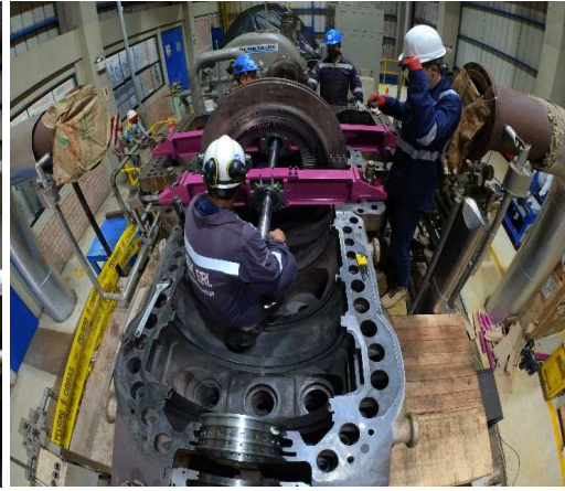
Montaje soportes HP y LP