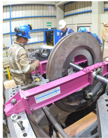
Detalle soporte LP IMG_20220510_190242_00_172