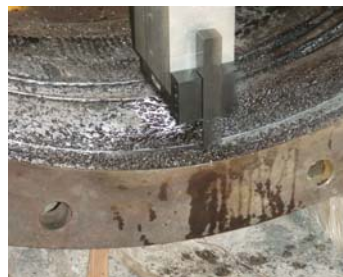
Maquinando la superficie