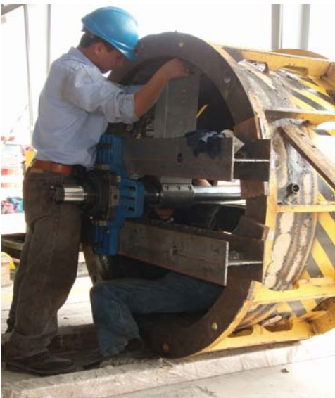
Fuente: P1311766.JPG Centrando la barrenadora