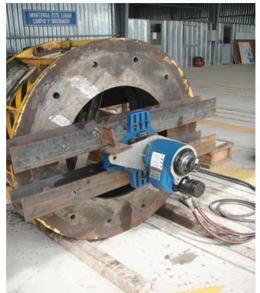
Fuente: P2021854 .JPG Lado motriz, con motor hidráulico